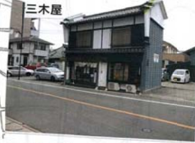
天王通りの和菓子屋。お団子が名物。