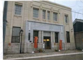
休憩のできる観光交流センター。 甘酒のみやげの靴屋。 信長めしの魚しまなどが近くにある。